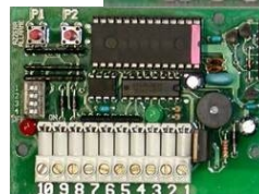
Art.A301 ...SC-2 Peso: 0.055kg.