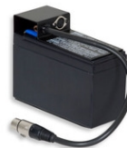
Art.828 BATTERIA RICARICABILE 12V/7Ah con connettori Dimensioni: 15.5x12.5x9cm. - Peso: 2.7kg.