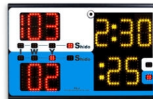
Art.164 ...PS-J Tabellone Segnapunti Portatile per JUDO

Questo modello è esaurito e NON VIENE PIU' PRODOTTO. Dimensioni: 55x35x9,5cm. - Peso: 3.7kg.