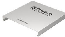
Art.900-06 ...Coperchio rullo in acciaio inox Parte ricambio Dimensioni: 34x34x4cm. - Peso: 1.7kg.