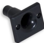
Art.900-04 GUIDAFILO per rullo Parte ricambio Peso: 0.01kg.