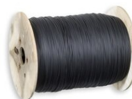
Art.900C1-M Cavo per rullo, tipo 900-C1 (1metro) Per ordinare una matassa della lunghezza desiderata Peso: 0.015kg.