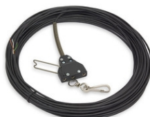
Art.907 Cavo 20m con presa volante per rullo Parte ricambio Peso: 0.3kg.