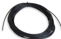
Art.900-C1 CAVO 20m per rullo Parte ricambio Peso: 0.3kg.