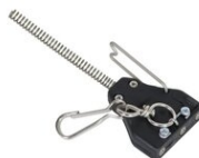
Art.906 PRESA VOLANTE PER RULLO, completa Peso: 0.05kg.