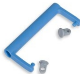
Art.905-02 Maniglia in plastica per valigetta grigia 60x40cm