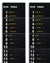
Art.262A ...#FS-414A pannelli laterali 2x14 giocatori ( Falli ) Dimensioni: 2x 120x320x11,5cm. - Peso: 165kg.