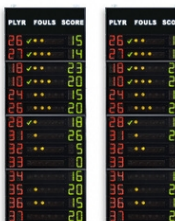
Art.262C FS-414C pannelli laterali 2x14 giocatori (n°maglia +falli +punti) Dimensioni: 2x 120x320x11,5cm. - Peso: 172kg.