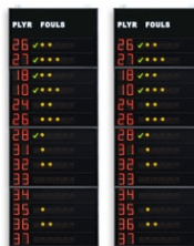
Art.262B FS-414B pannelli laterali 2x14 giocatori (n°maglia + falli) Dimensioni: 2x 120x320x11,5cm. - Peso: 168kg.