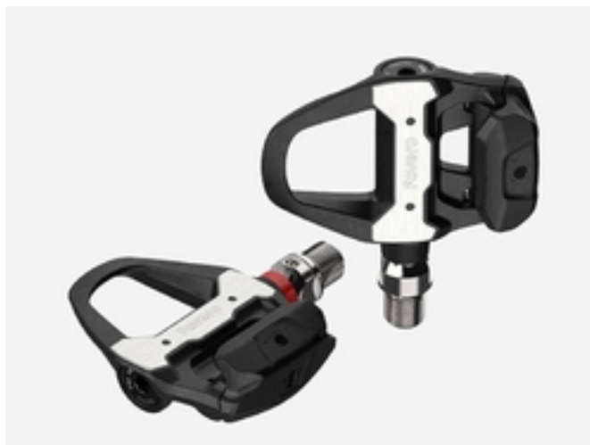
Codici articoli e prezzi (IVA esclusa)