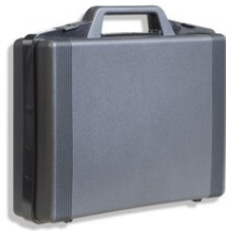
Art.140-12 Valise pour 12 télécommandes IR-REMOTE SCORER Pièce de rechange Dimensions: 33x26x8cm. - Poids: 0.4kg.