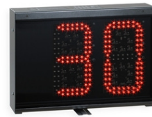
Art.259-01 FS-30s tableau d'affichage supplémentaire pour KIT-FS-30s Dimensions: 41x29x8,5cm. - Poids: 5,1kg.