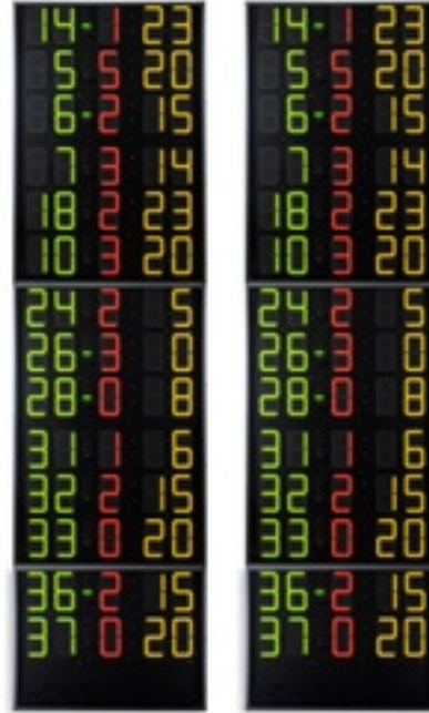
Art.262E FS-414E Panneaux latéraux 2x14 joueurs (n° Joueur + Fautes + Points), Chiffres 15cm Dimensions: 2x 80x300x11,5cm. - Poids: 117kg.