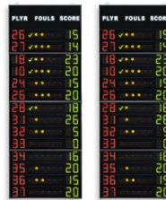
Art.262C FS-414C Panneaux latéraux 2x14 joueurs (n° joueur +fautes +points) Dimensions: 2x 120x320x11,5cm. - Poids: 172kg.