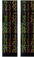
Art.262D FS-414D Panneaux latéraux 2x14 joueurs (n° Joueur + Fautes), Chiffres 15cm Dimensions: 2x 80x300x11,5cm. - Poids: 114kg.