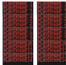
Art.262F FS-414F Panneaux latéraux 2x14 noms des joueurs Dimensions: 2x 145x300x11,5cm. - Poids: 206kg.