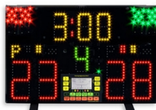
Art.940-01 FA-07-Panneau d'affichage, sans accessoires Dimensions: 55x35x9,5cm. - Poids: 4,2kg.