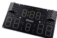
Art.0435-4350 SL SCH F1805 + F1806 carte à LED+avertisseur sonore pour FA-15 Pièce de rechange Dimensions: 34x20x6cm. - Poids: 0.3kg.