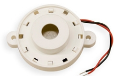
Art.0048-0160 Avertisseur sonore (buzzer) 105db-30cm Pièce de rechange Dimensions: 4.5x6x3cm. - Poids: 0.02kg.