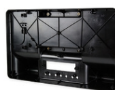
Art.0177-2620 FA-15 Boîtier panneau arrière en plastique noir Pièce de rechange Dimensions: 35x21x8cm. - Poids: 0.3kg.