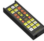
Art.938-12 Télécommande à infrarouge pour FA-15 Pièce de rechange Dimensions: 16x6x5cm. - Poids: 0.3kg.