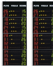
Art.262C FS-414C Panneaux latéraux 2x14 joueurs (n° joueur + fautes + points) Dimensions: 2x 120x320x11,5cm. - Poids: 172kg.