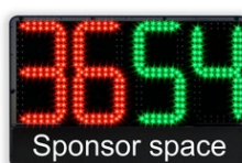
1-side, Only Front