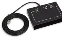
Art.232-03 Time-Console-03, consola supletoria para controlar el tiempo de juego y los 24/14/30s Dimensiones: 12x8.2x2.5cm. - Peso: 0.32kg.