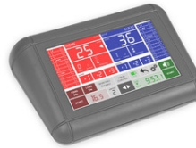
Art.308-01 Console-700, consola multideporte con pantalla táctil de 7 Dimensiones: 24.5x17x8.5cm. - Peso: 1.35kg.