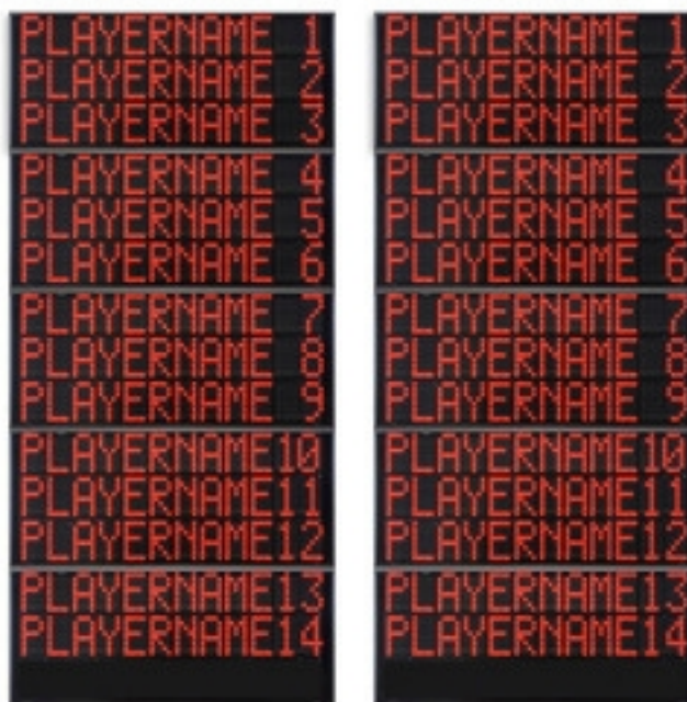
Códigos de artículos y precios (IVA no incluido)