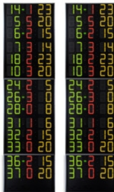
Códigos de artículos y precios (IVA no incluido)