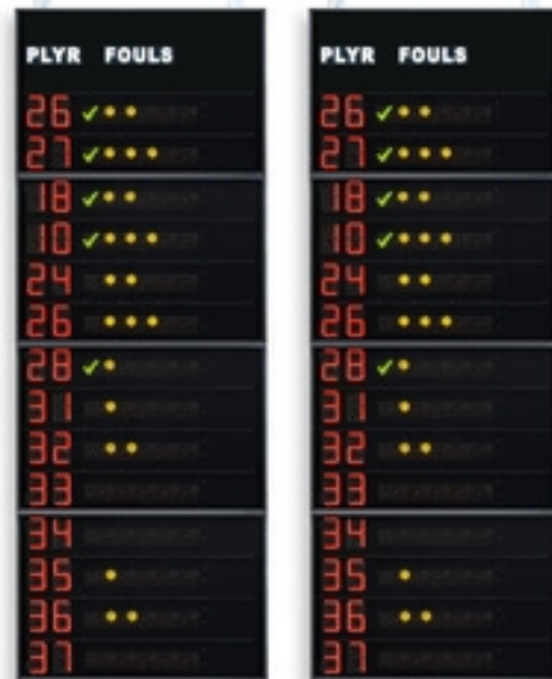
Códigos de artículos y precios (IVA no incluido)