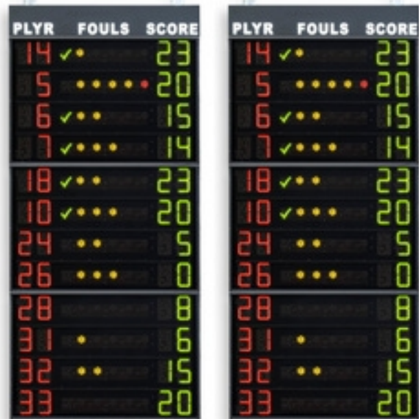
Códigos de artículos y precios (IVA no incluido)