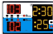
Art.164 ...# PS-J Tragbare Tisch-Anzeigetafel JUDO

This model is out of stock and it is NO MORE PRODUCED. Abmessungen: 55x35x9,5cm. - Gewicht: 3,7kg.