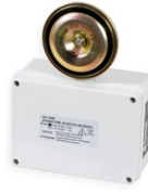
Art.333-PSX SIGNALHUPE 110db-2m für PS-X, mit 15m Kabel Abmessungen: 16x22x8cm. - Gewicht: 2.4kg.