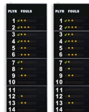
Art.262A FS-414A Seitliche Statistikanzeigen 2x14 Spieler (Fouls) Abmessungen: 2x 120x320x11,5cm. - Gewicht: 165kg.