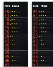
Art.262B FS-414B Seitliche Statistikanzeigen 2x14 Spieler (Trikotnr. + Fouls) Abmessungen: 2x 120x320x11,5cm. - Gewicht: 168kg.