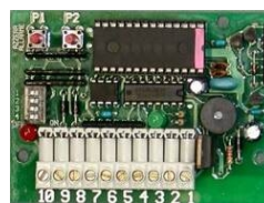
Art.A301 ...SC-2 Gewicht: 0.055kg.