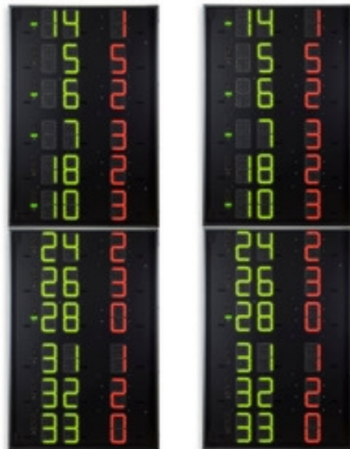
Artikelnummern und preise (zzgl. MwSt.)