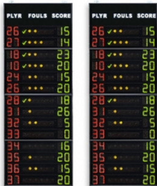
Artikelnummern und preise (zzgl. MwSt.)