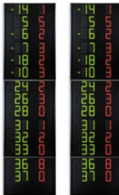
Códigos de artículos y precios (IVA no incluido)