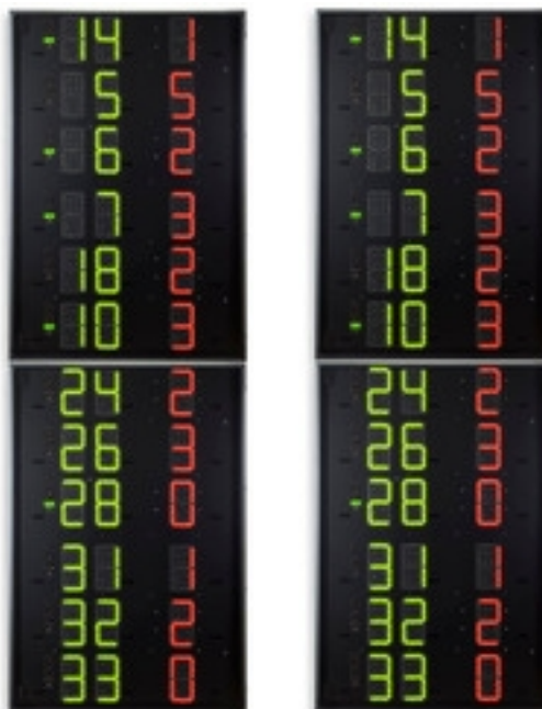
Códigos de artículos y precios (IVA no incluido)